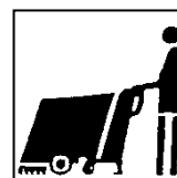
verwerken met schrob-/zuigmachine