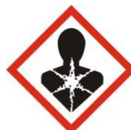
Schadelijk op termijn