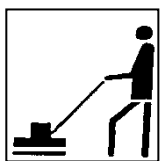
verwerken met eenschijfsmachine